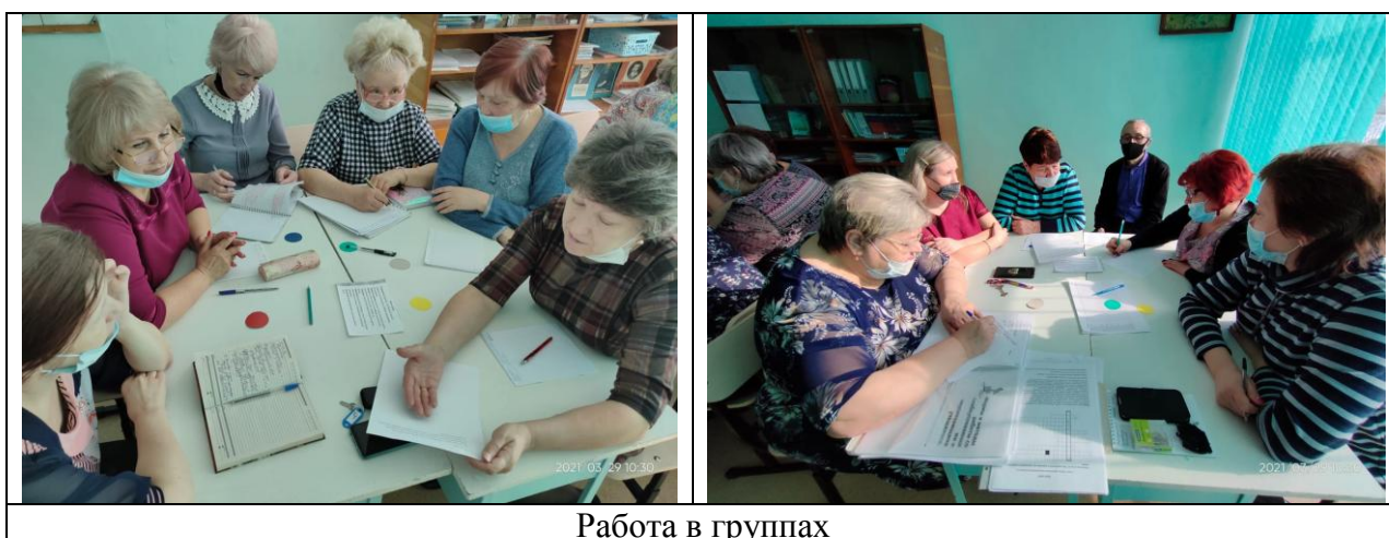
Работа в группах

Общим решением принято проведение декады обмена педагогическим опытом в форме взаимопосещения уроков с целью повышения эффективности урока с использованием АМО.