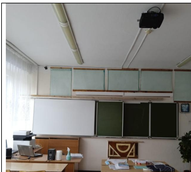
кабинет математики № 14

На основании проведенного аудита компьютерной техники проведено оснащение кабинетов математики (№14,15,17,18) компьютерным мультимедийным, презентационным оборудованием.