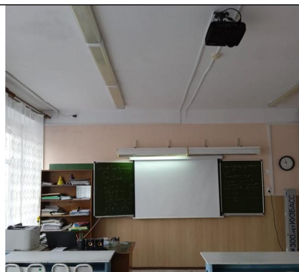
кабинет математики № 15